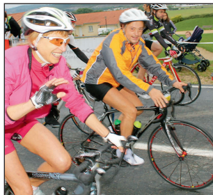
Les Moirantins dans la course, avec le sourire.

► Dominique Piazzolla Photos D.P. et La Forestière