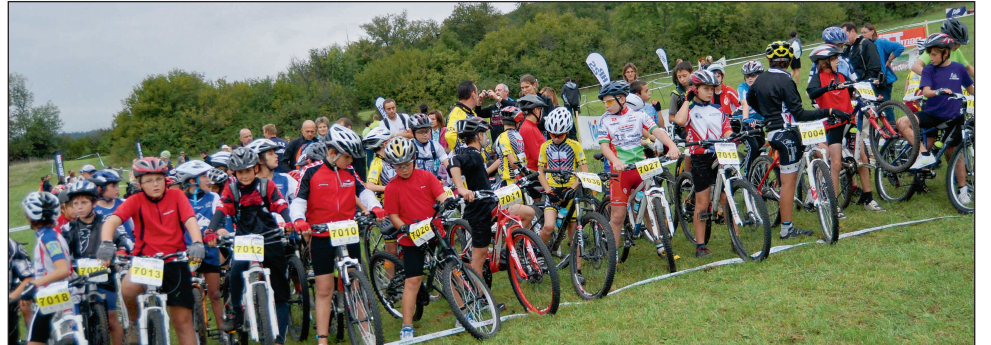
Départ de la «Kid» 8 km à Arbent.