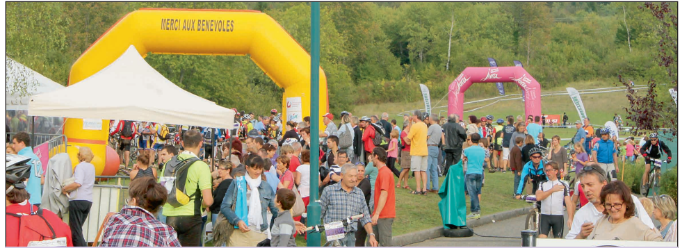
Beaucoup de monde sur le stade d'arrivée à Arbent, près du centre de Loisirs.