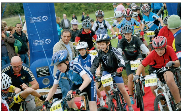
La course de la «Kid» 8 km.