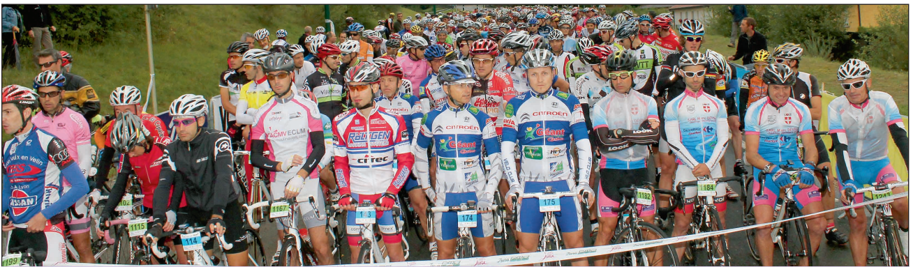
Quelques minutes avant le départ de la cyclosporitive, cyclo Rando des 160 km, 120 km et 80 km.