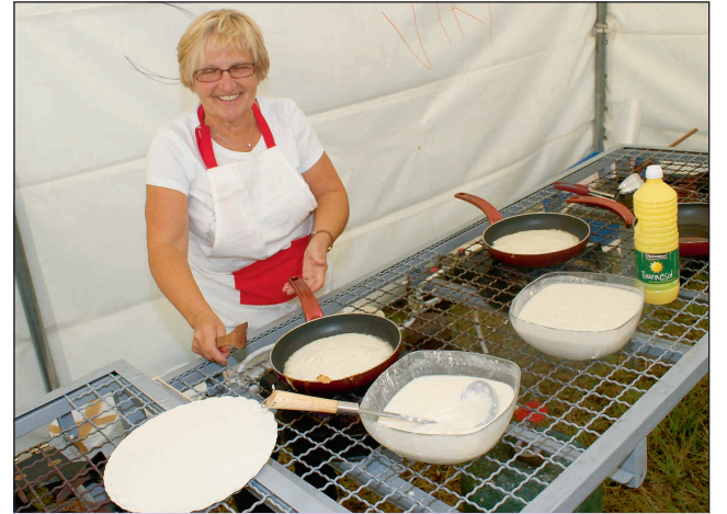
Au ravitaillement à «La Tour», «Les Michons», spécialités de Viry, ont été appréciés de tous.