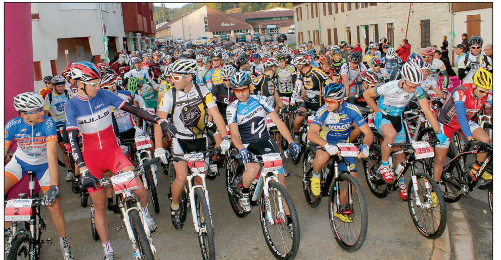
A quelques minutes du départ des 100 km marathon de Prémamon.