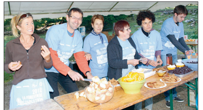
Dans la bonne humeur, les bénévoles de La Pesse, au ravitaillement près de la Borne au Lion, se préparaient avant le grand rush.