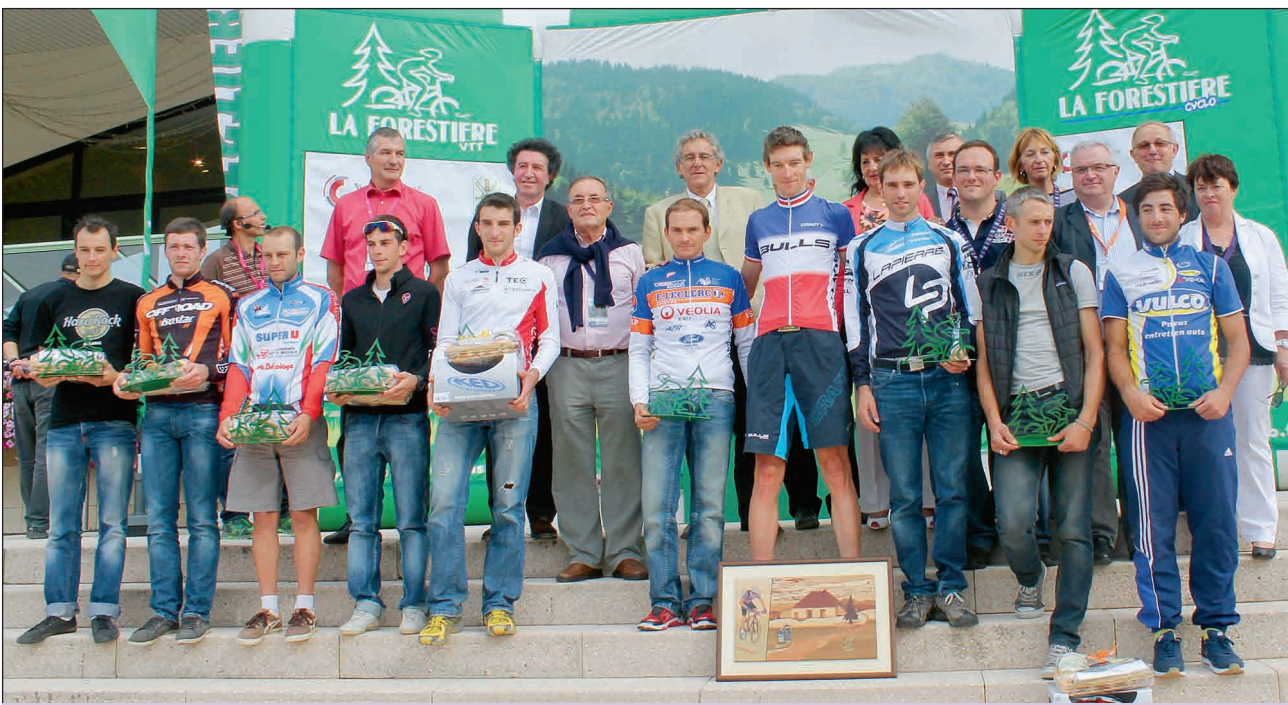
Le podium scratch des dix premiers des 100 km, entourés des élus des deux départements l'Ain et le Jura, la Région Franche-Comté et les organisateurs.