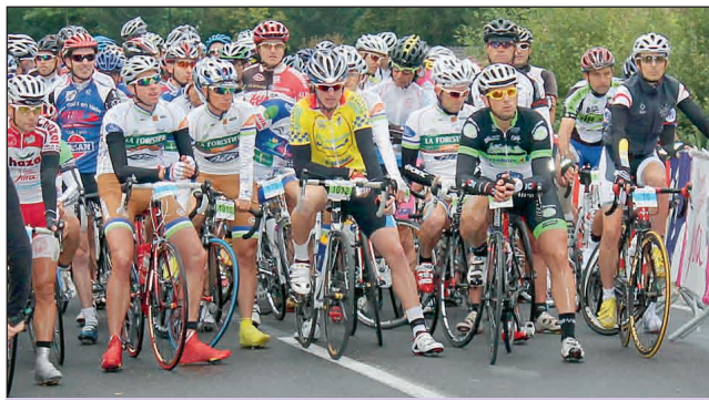
Quelques minutes avant le départ de la première ligne de l'élite de la cyclosporitive.

Les organisateurs avaient annoncé une nombreuse participation à cette 22e édition de la cyclosporitive et cyclo-rando avoisinant les 800 participants si le temps le permettait. Mais une nouvelle fois le temps maussade et la pluie annoncée a freiné la venue de ces cyclos qui s'inscrivent en masse le matin même. Ils étaient donc un peu plus de 400 au départ d'Arbent à s'élaner sur les différents parcours, 160 km pour la cyclosporitive, 120 km sur la cyclosporitive et la cyclo-rando, ainsi qu'un 80 km sur la cyclo-rando. Un ¼ heure après