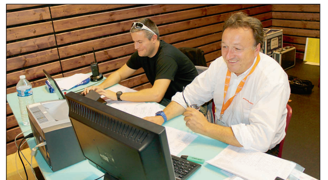
Comme d'habitude, le service informatique a fonctionné à merveille pour les résultats et la mise en ligne sur internet. Merci à Rémi et Stéphane de sportcommunication.com