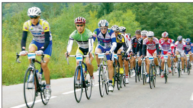
Entre Arbent et Désertin, les premiers de la cyclosporitive du 160 km.