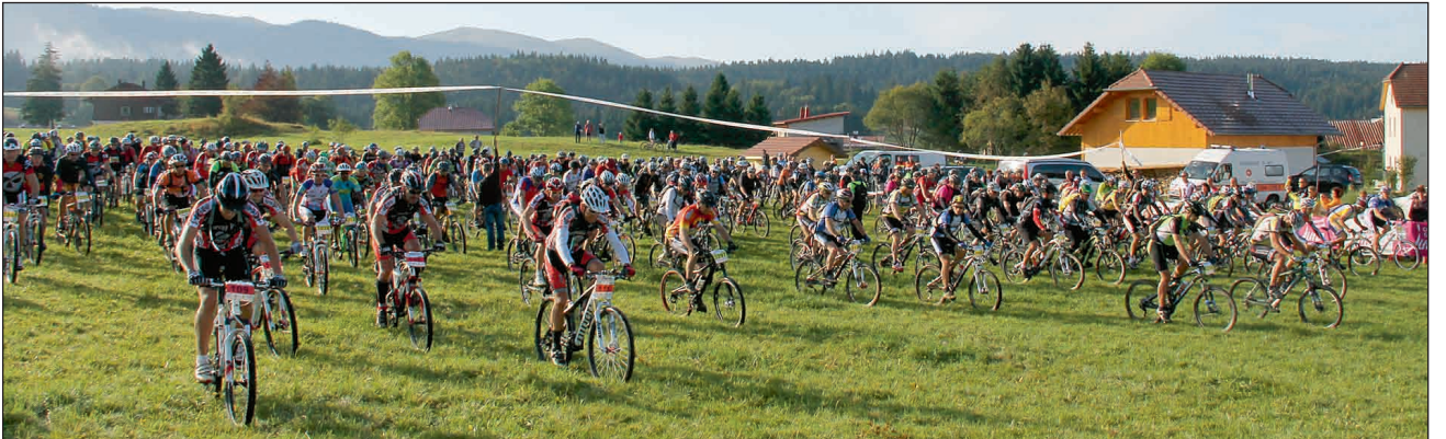
Départ des 80 km de Lajoux.